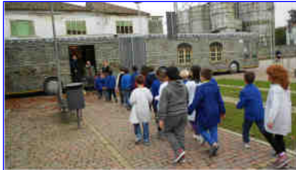
SCUOLA PRIMARIA "P.GIULIANI" DI MENA'