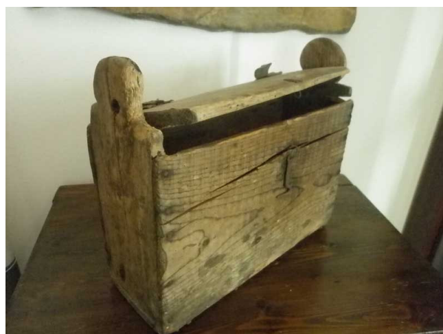
Cartella di legno.